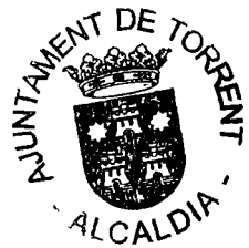
Amparo Folgado Tonda.