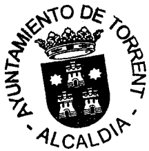
Amparo Folgado Tonda.