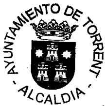
Amparo Folgado Tonda